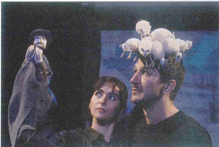
« L'homme qui plantait des arbres »

Créé en 2013 par la compagnie française Arketal d'après la nouvelle engagée, poétique et philosophique de Jean Giono, L'homme qui