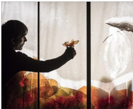
Un spectacle d'une grande sensibilité.

Sur des panneaux japonais, la peinture raconte, l'encre dessine, les couleurs s'ajoutent et les marionnettes sont nos héros vivants. Le Théâtre l'Article a présenté son spectacle “Après l’hiver” dimanche 21 octobre au pôle culturel de Vallorcine dans le cadre du festival “Les petits asticots” organisé par les communautés de communes de Chamonix et de Saint-Gervais.